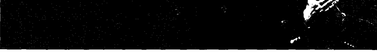
زعيم الجبهة اليمينية للطرفة جان ماري لوين يحيي انصاره في لقاء انتخابي (رويتز)

باريس - اف بيه - افاد مراسل وكالة فرانس برس ان 39 مليون فرنسي انتخبوا برلمانا جديدا في الانتخابات التشريعية الفرنسية التي جرت في 17 و18 ايار. وقال المرصد الفرنسي للانتخابات ان نتائج الجولة الاولى من الانتخابات تعادلت بين اليمين واليسار. وقال المرصد الفرنسي للانتخابات ان نتائج الجولة الاولى من الانتخابات تعادلت بين اليمين واليسار. وقال المرصد الفرنسي للانتخابات ان نتائج الجولة الاولى من الانتخابات تعادلت بين اليمين واليسار.